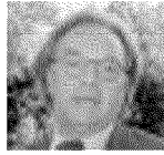
Diego Della Valle