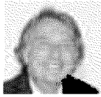
Luca di Montezemolo