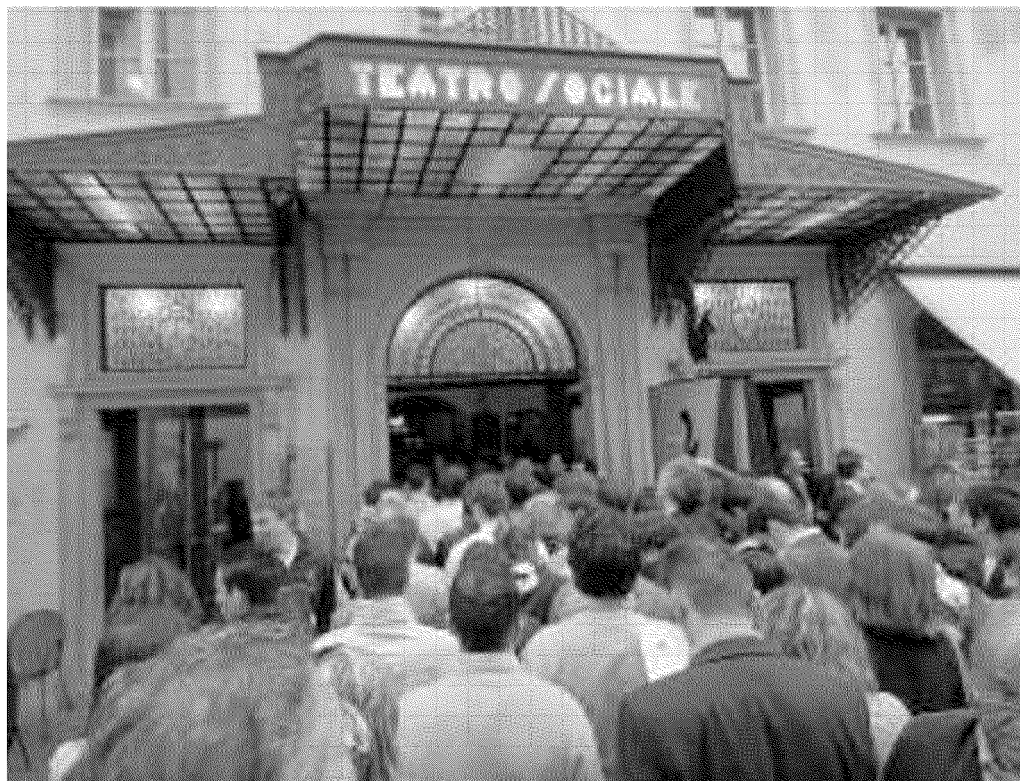
Il Festival dell'economia è sempre molto atteso. E c'è da far la fila per guadagnarsi un posto a sedere