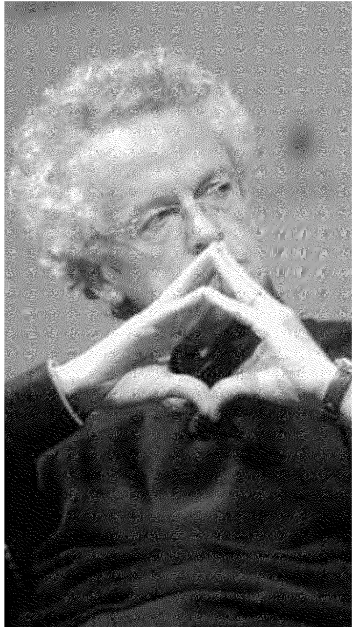
Federico Rampini, giornalista e scrittore

«Alcuni economisti hanno previsto la crisi: non li hanno creduti»