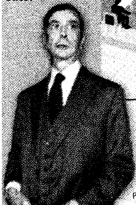
Partners - LA STAMPA