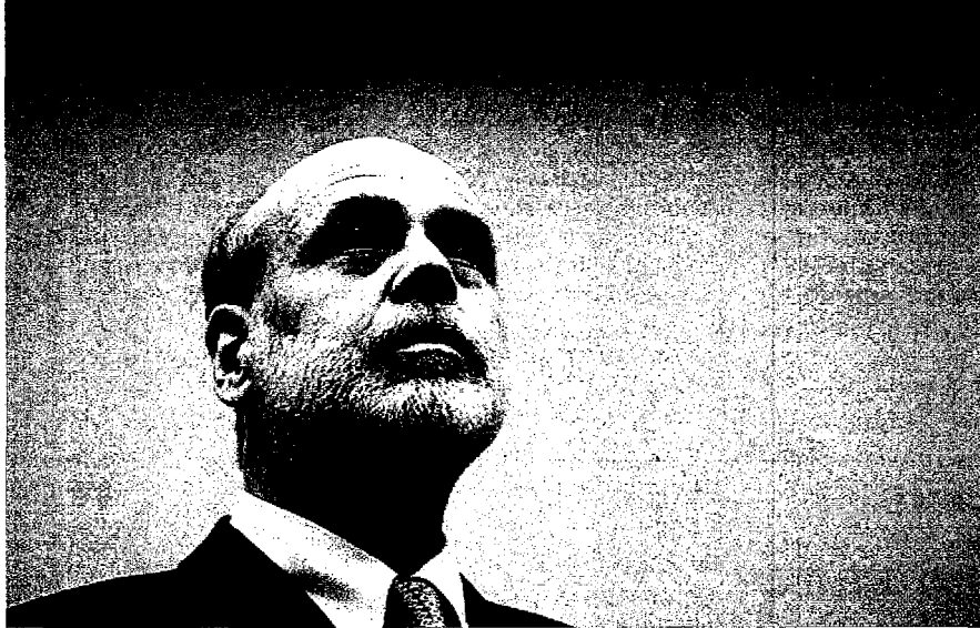
Governatore. Ben Bernanke, presidente della Federal Reserve dal 1° febbraio 2006