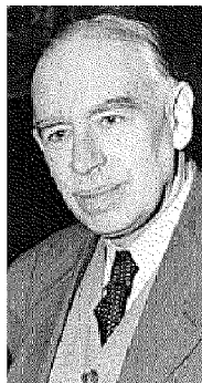
L'economista John Maynard Keynes