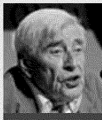
Professore Ronald Dore

TRENTO — La cultura di Wall Street impone come regola non scritta quella di giudicare un manager in base a quanto quest'ultimo riesce a «portare a casa»: secondo Ronald Dore, professore del Center for economic performance della London School of Economics, gli intermediari del mondo anglosassone sono i principali colpevoli del crollo del mercato economico per via della loro implacabile fame di reddito. Percentuali del 7% o del 9,5% non erano sufficienti. Si è voluto raggiungere il picco del 45% negli anni tra il 2000 e il 2002, per arrivare inevitabilmente al collasso del gennaio 2008.