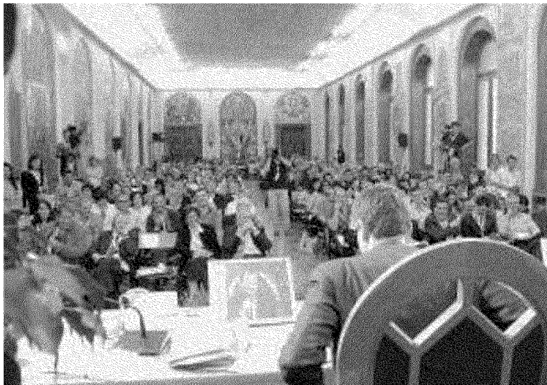
Sul banco degli imputati nell'anno della crisi sono economisti, politici e finanza