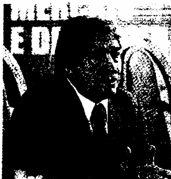
Presidente Innocenzo Cipolletta guida Ferrovie dello Stato

CIPOLLETTA: «Ottimisti al cento per cento, senza per questo essere creduloni. L'innovazione tecnologica continuerà a produrre soluzioni ai problemi di oggi, ma farà sorgere i nuovi problemi di domani. È sempre stato così. La storia dell'umanità ci dice che, pur con qualche incertezza, il progresso ci ha consentito di uscire da situazioni ben peggiori di quelle che stiamo affrontando oggi. Da qui il mio ottimismo».